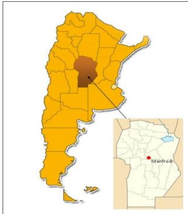
Figura 1. Ubicación de la Zona de estudio en Manfredi, Córdoba, Argentina.

Dada la importancia de este parámetro, se trabajó con varios métodos de medición de la humedad en suelos: métodos gravimétricos, sensores de capacitancia y sonda de neutrones. Se analizaron los resultados, ventajas y desventajas de utilizar cada uno.