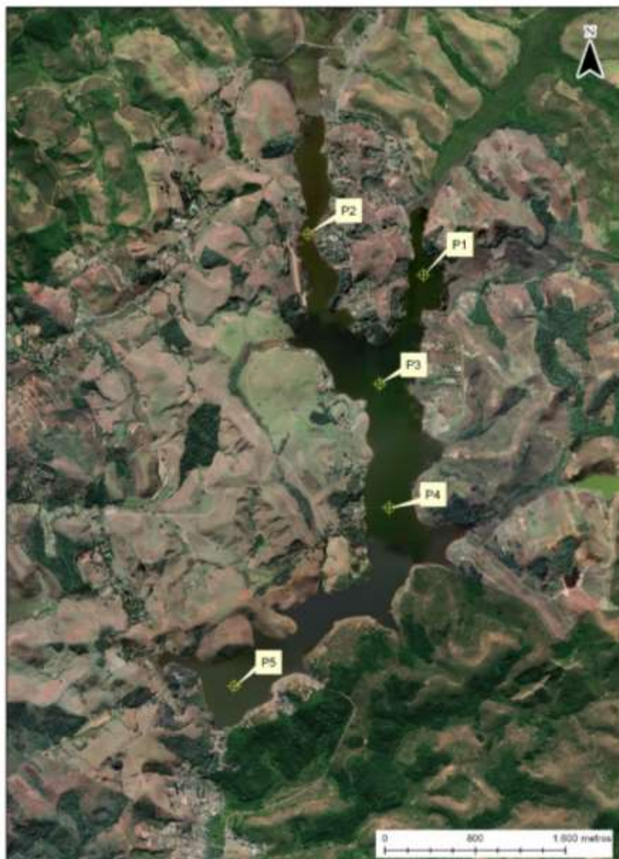
Figura 1. Ortofoto do voo aerofotogramétrico, datada de 2007, indicando os cinco pontos de amostragem na Represa Dr. João Penido.