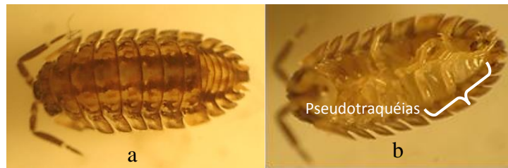
Figura 2. Vista dorsal evidenciando a forma quadrangular do télson, projeção quadrada no cefalotórax, curvatura do corpo e capacidade volvocional (a). Vista ventral ressaltando os cinco pares de pseudotraquéias (b).

claro; cinco pares de pseudotraquéias; um par de olhos pequenos e compostos (Figura 2a e 2b).